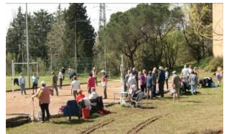
Concours de boules à Azuréva