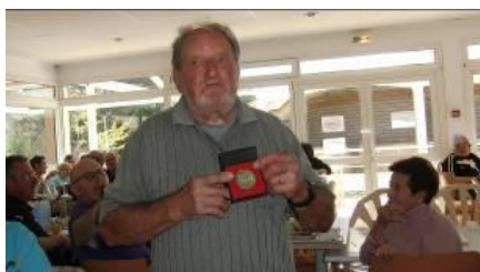
Remise de Médaille