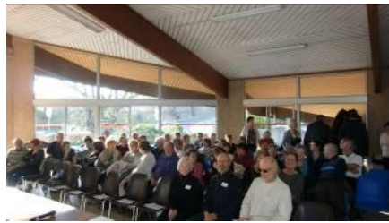
Participants à l'A.G.

Bonne participation de nos adhérents ; cette A.G. s'est déroulée dans une bonne ambiance suivie du pot de l'amitié.