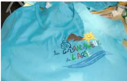
Tee-shirt des randonneurs de l'ARSE Réalisé par la section « Arts Créatifs »