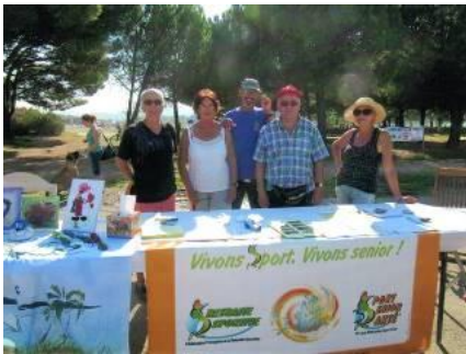
Stand de l'ARSE Fête du Sport à la Base Nature

La nouvelle Saison Sportive 2015 à commence par la « Fête du Sport et des Associations » à Fréjus - Base nature. Notre Club était présent et l'impact fut favorable.