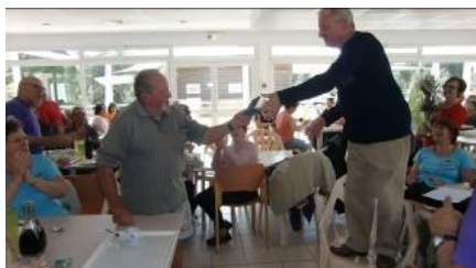
Remise de Médaille